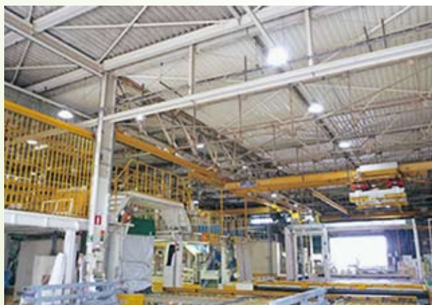
工場天井照明の施行例

具体的な販促活動としては、水銀灯や蛍光灯をLED照明に切り替えた際の照度シミュレーション、費用償却の経済シミュレーションなどを作成し、最適な照明環境としてお客様に提案させていただき実績へとつなげて