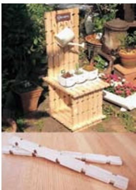
組手什甲賀とその使用例