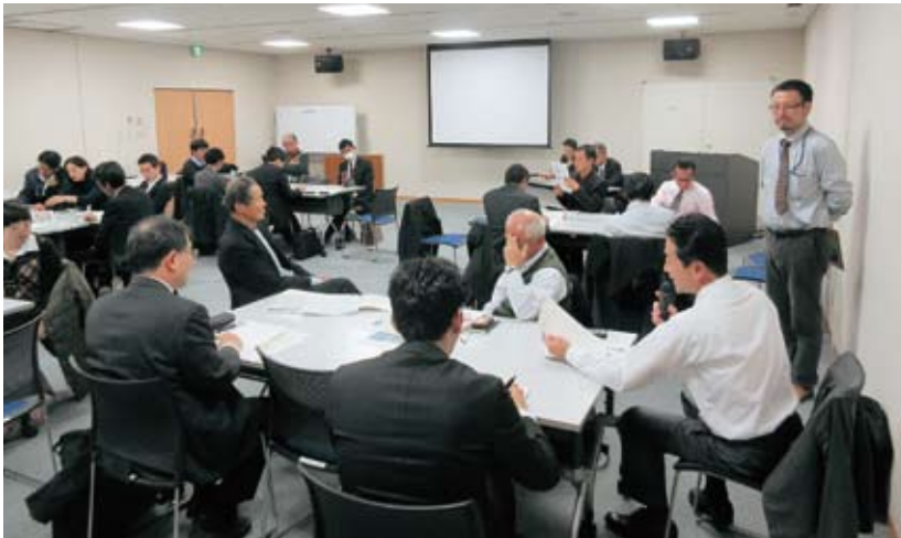
キックオフセミナーの様子（会場：コラボしが21）